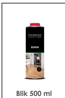
Blik 500 ml